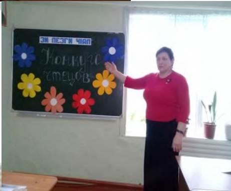
а) чтение стихотворений. 1-10 кл.